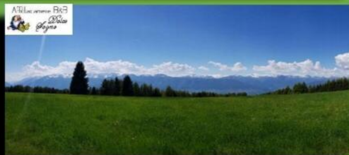
Panoramica sul colle della Predaia