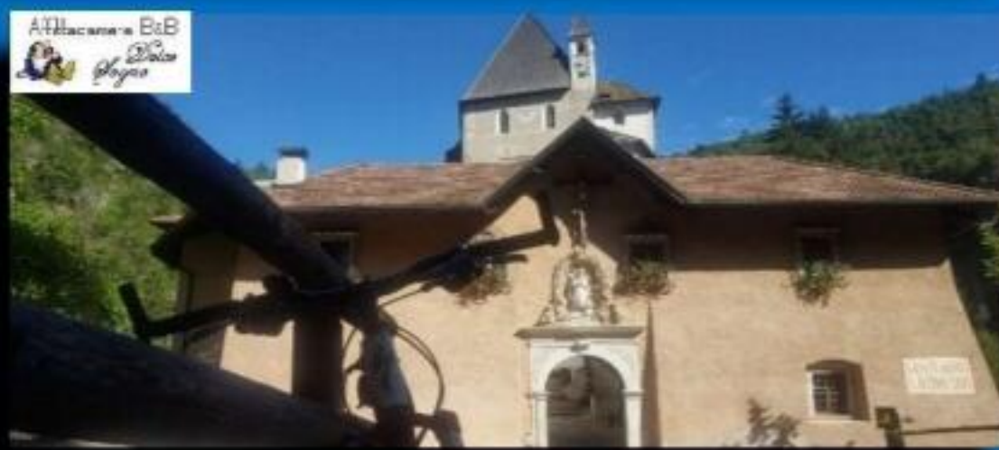
Eremo di San Romedio

Un'avventura sui sentieri dei nostri territori della Predaia e non solo, tra laghi, panorami suggestivi e gastronomie locali tutto reso più facile e divertente dalle nostre mountain bike a pedalata assistita che ti daranno una mano quando serve