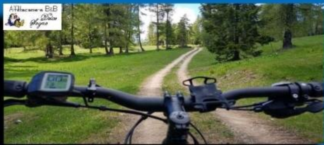
Panoramica malga Coredo