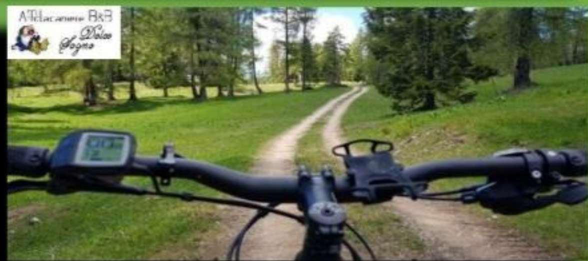
Panoramica Malga Coredo