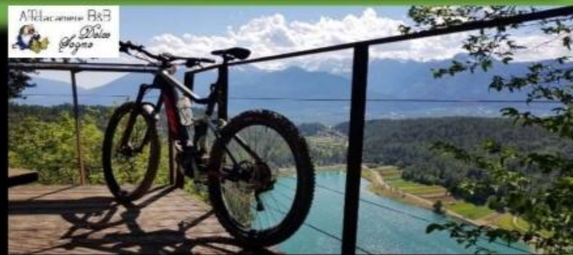
Merlonga Poggiolo sui laghi di Coredo e Tavon