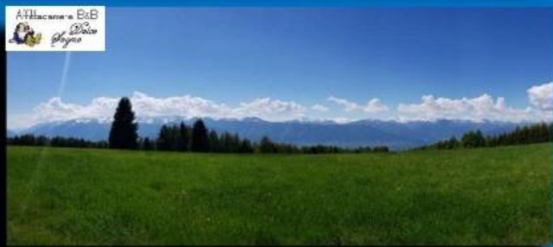
Panoramica cima Predaia