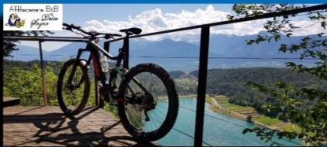
Panoramica sui laghi Merlonga