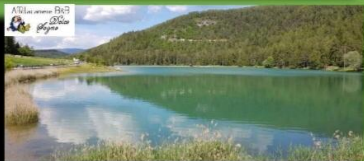
Lago di Coredo